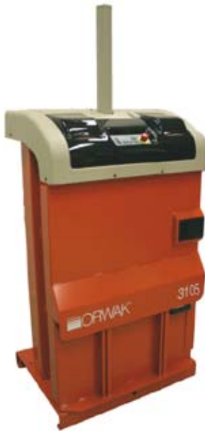
Die kleinste Ballenpresse in Orwaks Sortiment

Die Ballenpresse ist mit Autostart ausgestattet und fängt an das Material zu verpressen sobald der Bediener die Tür schließt.