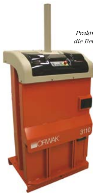
Praktisches Fach für die Betriebsanleitung

Die Ballenpresse ist mit Autostart ausgestattet und fängt an das Material zu verpressen sobald der Bediener die Tür schließt.