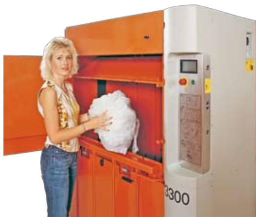
Verschiedene Arten von Materialien, z.B. Papier und Kunststoff, sind einfach zu befüllen und pressen.

Orwak 3300 ist das Ergebnis von mehr als 30 Jahren Erfahrung. Sicher einfach und zuverlässig zu bedienen. Eine schnelle und starke Presse.